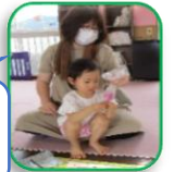
花をビニール袋に入れてもみもみ