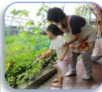
朝顔をやさしく探って