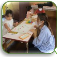
スタンプ遊びをしたよ。○△ポンポンと!