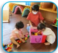
友だちの名前を覚えて一緒に遊んだよ。